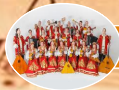
Оркестр народных инструментов